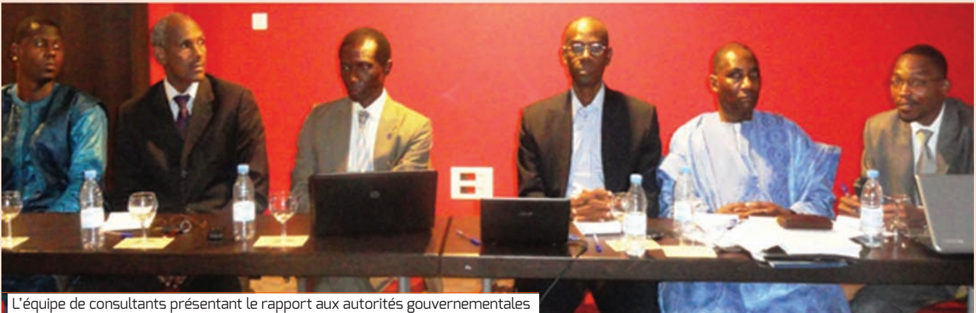
L'équipe de consultants présentant le rapport aux autorités gouvernementales

Après un audit interne réalisé en 2010 par une équipe composée de l'Inspection Générale des Finances (IGF), de l'Inspection interne du Ministère chargé de l'Enseignement Supérieur, de la Direction du contrôle interne, de la Direction Générale de la comptabilité publique et du Trésor, le Gouvernement du Sénégal a commandité un audit externe des bourses en 2013. L'objectif visé était de mesurer l'efficacité des dépenses des bourses et la formulation de recommandations pour une meilleure politique d'attribution et de gestion des bourses. C'est dans ce contexte que, suite à un appel d'offres, une mission d'audit des bourses au Sénégal a été confiée