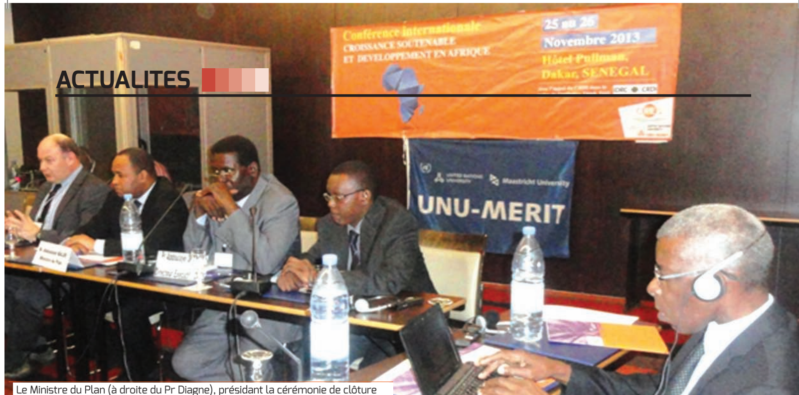
Le Ministre du Plan (à droite du Pr Diagne), présidant la cérémonie de clôture