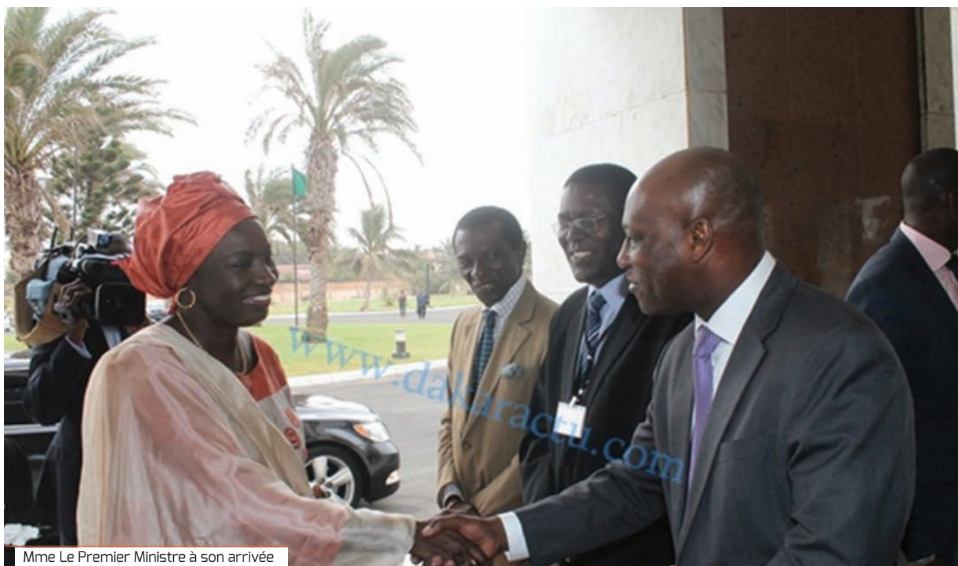
Mme Le Premier Ministre à son arrivée

Cet espace d'échanges, de discussions et de renforcement mutuel est une initiative du CRES et du Secrétariat Permanent de la Stratégie de Croissance Accélérée (SCA), soutenue par le CRDI dans le cadre de l'Initiative Think Tank. L'idée de l'organiser chaque année a été retenue.