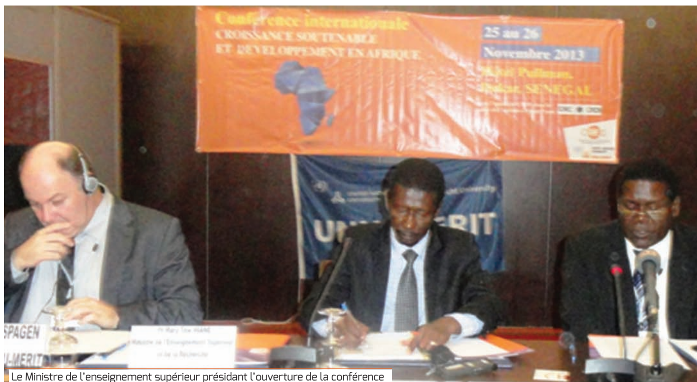
Le Ministre de l'enseignement supérieur présidant l'ouverture de la conférence

Une recherche de qualité, au service du développement