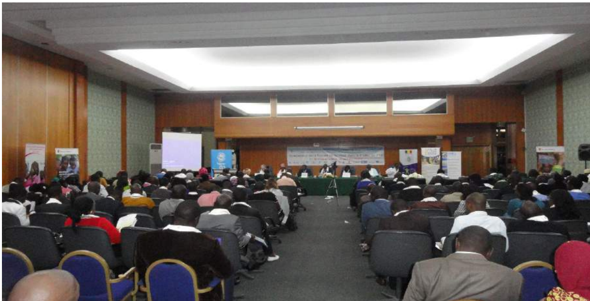
✓ Symposium sur l'Enfant au Sénégal : l'expertise du CRES partagée