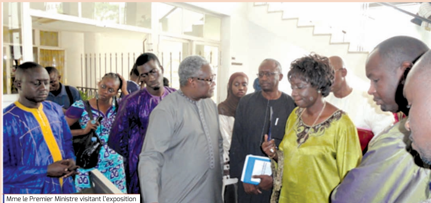
Mme Le Premier Ministre visitant l'exposition

Honorables parlementaires ; Madame la Représentante de l'OMS ; Messieurs les Directeurs ; Messieurs les chefs de services nationaux ; Mesdames et Messieurs les acteurs de la société civile ; Chère jeunesse ; Chers invités.