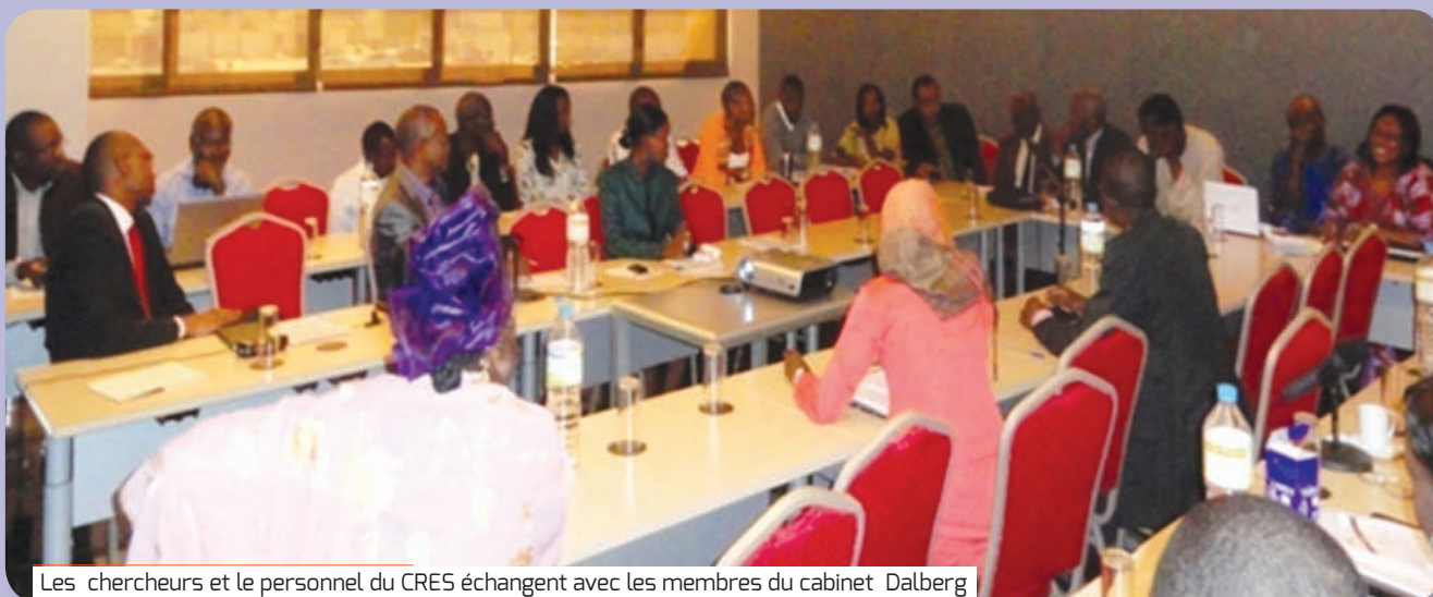
Les chercheurs et le personnel du CRES échangent avec les membres du cabinet Dalberg

D u 18 au 19 février 2013, le CRES a organisé, avec le cabinet Dalberg, un atelier consacré à l'élaboration de son plan stratégique 2013-2017.