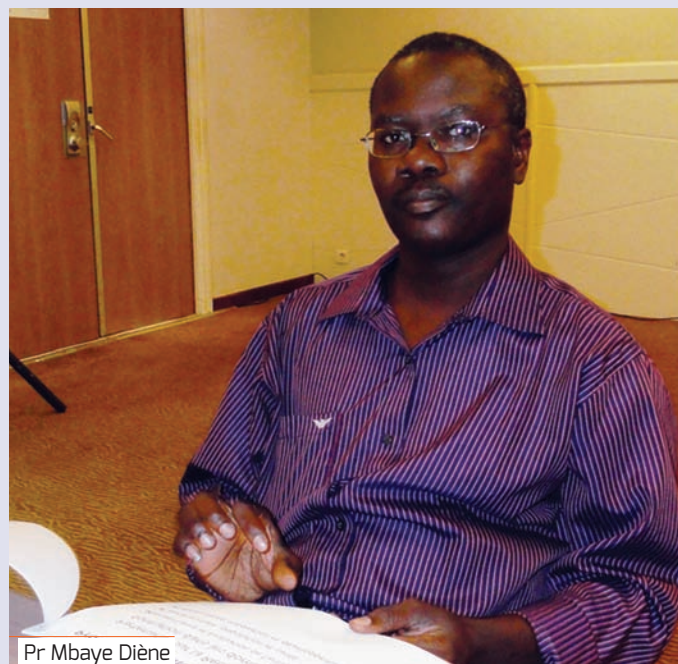
Pr Mbaye Diène

Le manque d'informations, d'indicateurs précis et de capacité d'analyse technique pour conce-