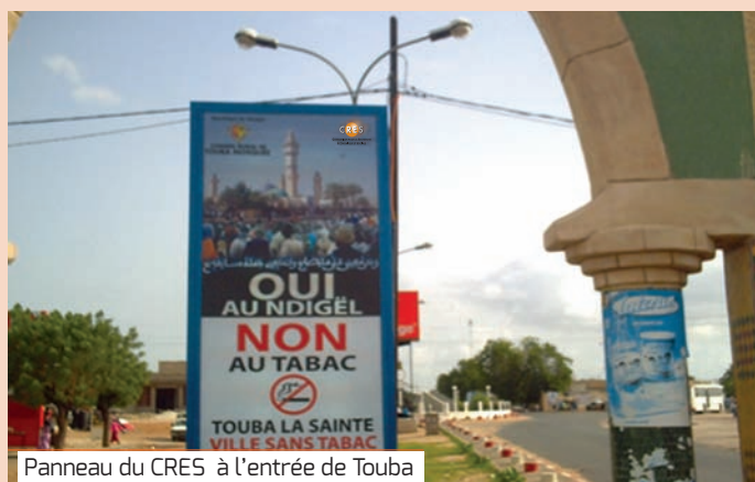
Panneau du CRES à l'entrée de Touba

Le CRES, le Laboratoire d'Analyse des Politiques Publiques (LAPP) de la Faculté des Sciences Economiques et de Gestion, et le Centre de Recherche et de Documentation sur les Institutions et les Législations Africaines (CREDILA) de la Faculté des Sciences Juridiques et Politiques, de l'Université Cheikh Anta DIOP de Dakar, ont développé en 2006 un programme de recherche multidimensionnelle sur le tabagisme au Sénégal.