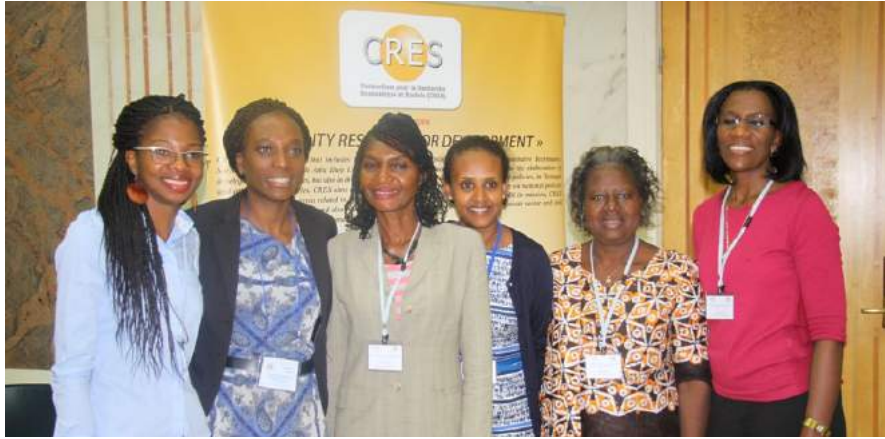
Des participantes à la deuxième conférence internationale sur le développement durable en Afrique