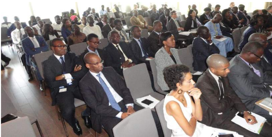
Les participants à l'atelier de lancement du rapport sur les perspectives économiques régionales de l'Afrique subsaharienne