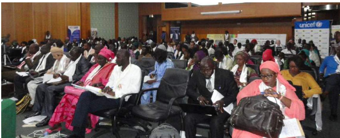
Les participants au Symposium