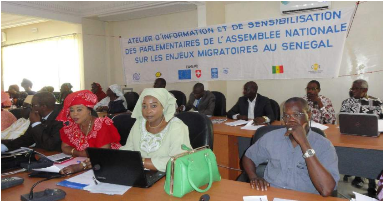
Les Parlementaires au premier plan

Des députés membres du Réseau pour la défense, la promotion et l'insertion des Sénégalais de l'extérieur ont pris part, le 2 juillet 2015, à une journée d'information et de sensibilisation sur la problématique des migrations, organisée par le CRES et de l'Organisation Internationale pour les Migrations (OIM) à l'Assemblée nationale.