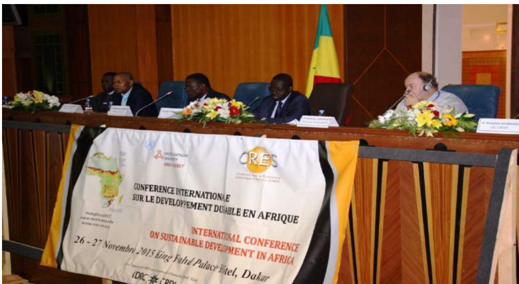
Le Présidium de la conférence